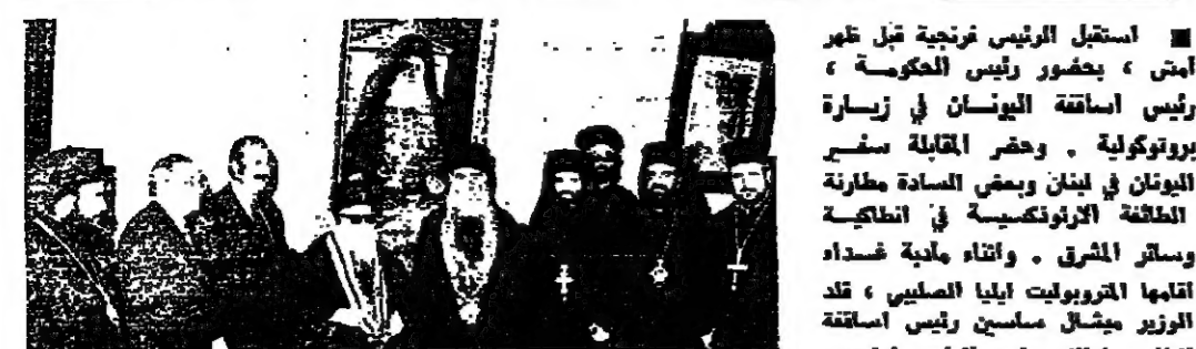
استقبل الرئيس فخرية قبل ظهر امس، بحضور رئيس الحكومة، رئيس اساقفة اليونان في زيارة برونوكوية. وحضر القابلة سفر اليونان في لبنان ورئيس السادة مطارنة الملائكة الأرثوذكسية في الطائفة وسائر المشرق. واتناء عادية غداء اقامها القروبوليت ايليا الصليبي، قد الوزير ميشال ملسين رئيس اساقفة ايتنا وسام الارز باسم الرئيس فخرية.

كما تد رئيس الاساقفة اليوناني القروبوليت الصليبي اليرواح الاكبر للتدبير بولس. وفي الصورة الاولى الرئيس فخرية ورئيس الحكومة السيد رشيد الصالح يحيط بهما رئيس اساقفة اليونان واصحاب السيادة المطارنة ويبدو سخر اليونان في الصورة الثانية جانب من حفلة تظيد الوسليين.